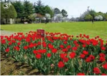
③多目的広場 いろいろなスポーツやレクリエーションを 楽しめます。