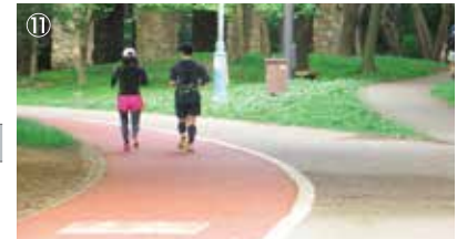
⑪ジョギング・ウォーキングコース