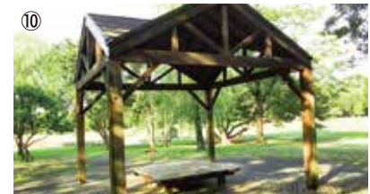
⑩あずまや 屋根つきの休憩施設が4ヶ所あります。