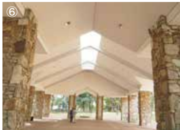
⑥大型休憩舎 面積460㎡の休憩舎。 災害時には避難施設として利用します。