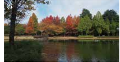
⑧下池 池に面したあずまやがあり、四季の風景を眺めながら休憩できます。3台の小型噴水もあります。 噴水時間（約15分間） 11:07、12:37、14:07、15:37