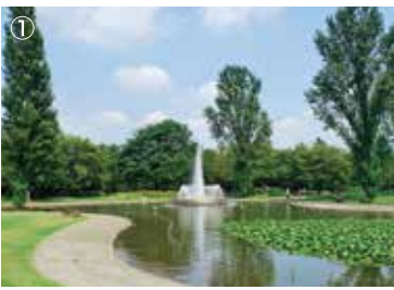
①上池 大きな円形噴水は公園のシンボルです。 噴水時間（約15分間） 10:22、11:52、13:22、14:52