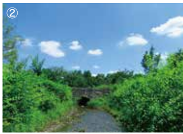
②せせらぎ 2つの池を結ぶ255mの水辺空間。 こどもたちに大人気のエリアです。