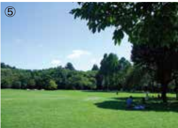
⑤芝生広場 広々とした芝生の上で、ひなたぼっこや ピクニックが楽しめます。