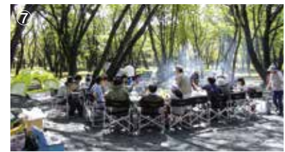
⑦BBQガーデン BBQを楽しむ人気エリアとなっています。 (3月~11月 ※要予約)