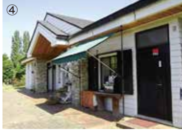
④管理センター 公園の利用案内、イベントの受付などを しています。受付時間 8:30~17:00 (年末年始を除く)。