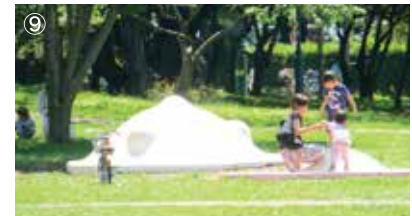
⑨コバトン広場 幼児用のふわふわ遊具で遊べます。