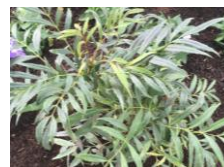
マホニアコンフーサ (メギ科) 低木