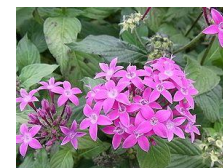
ペンタス (紫) (アカネ科) 低木