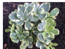
ファイリフックスウ (ツゲ科) 低木