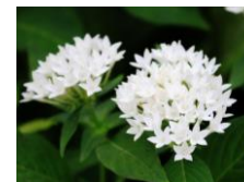
ペンタス (白) (アカネ科) 低木