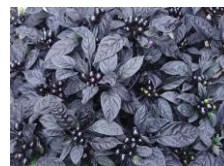
五色トウガラシ ブラックパール (ナス科) 一年草