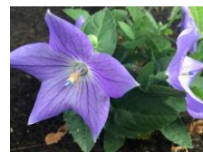
キキョウ (キキョウ科) 多年草