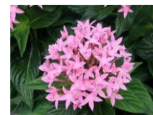
ペンタス (ピンク) (アカネ科) 低木